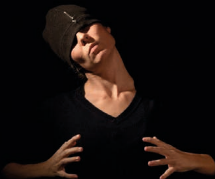
Silence - Théâtre de la Peau